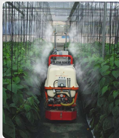
FitoRobot® aplicando tratamiento fitosanitario

FitoRobot® consiste en sí mismo una evidente novedad mundial en el campo de la maquinaria destinada a la ejecución de operaciones en invernaderos ya que permite disponer de un equipo para realizar trabajos en el interior de los invernaderos sin la necesaria presencia de operarios.